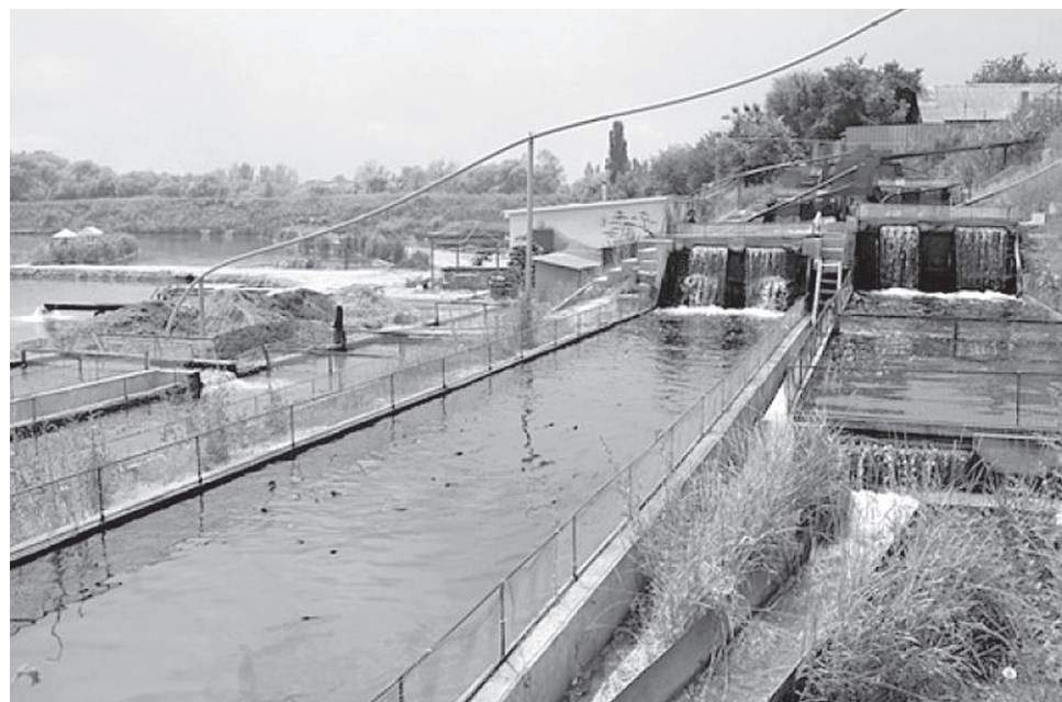
Основой стабильного роста экономики Новооскольского городского округа остаётся сельскохозяйственное производство