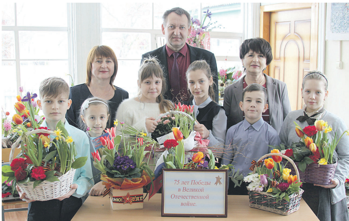
Авторам лучших работ предстоит защищать свои проекты в областном центре

ОБЩЕСТВЕННО-ПОЛИТИЧЕСКАЯ ГАЗЕТА НОВООСКОЛЬСКОГО ГОРОДСКОГО ОКРУГА Издаётся с августа 1921 года 12+