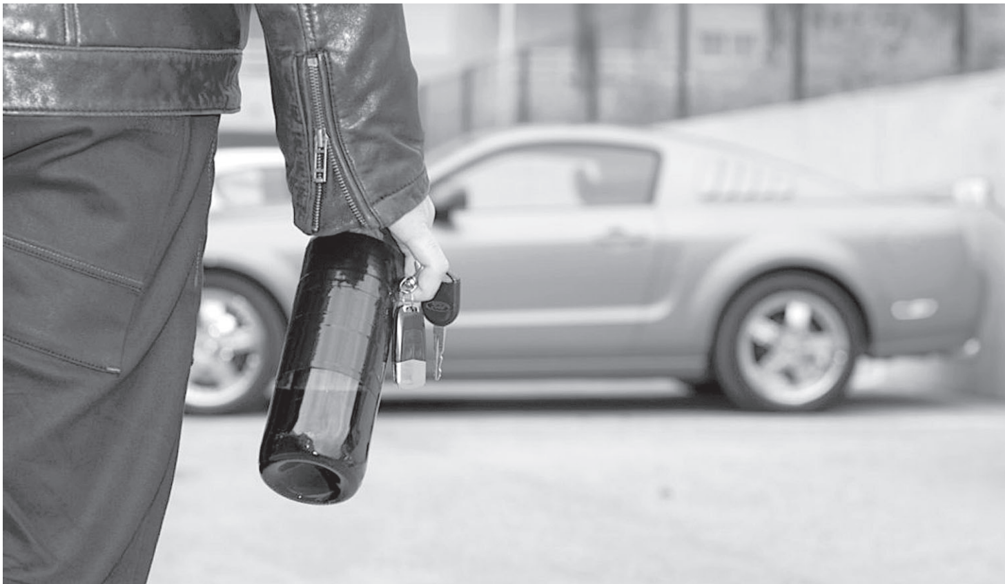
Выпил – иди пешком...