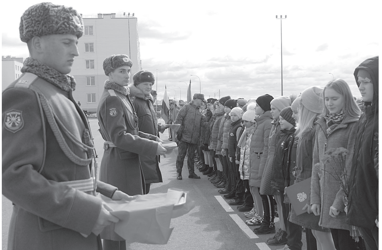
Церемония приведения к торжественной клятве юнармейцев

– Вот вы отметили воинскую дивизию, присутствие в которой оставляет хороший отпечаток в памяти мальчи-