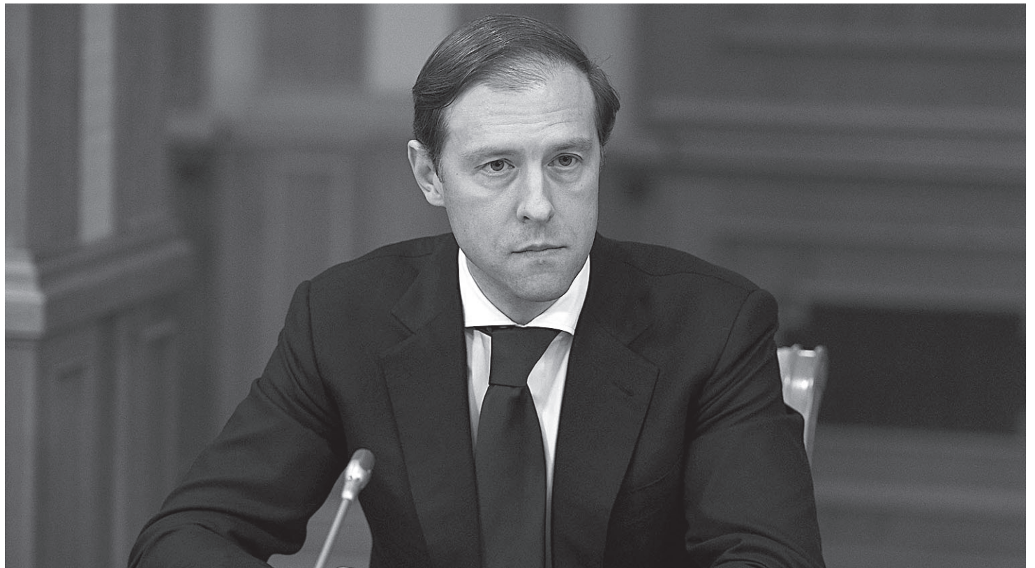
Денис Мантуров: «Льготными кредитами на пополнение оборотных средств воспользовались свыше 300 системообразующих организаций»

– Из того перечня, который рекомендован для лечения коронавируса, противовирусные препараты полностью производятся в России. Объем их выпуска в декабре 2020 года по сравнению с апрелем 2020-го вырос в 3,5 раза, причем только в декабре приросли на 57% к ноябрю. По антибиотикам мы стремимся к тому, чтобы обеспечить их локализацию до уровня субстанции, и уже существенно нарастили объемы их производства. Это азитромицин (прирост 540%), левофлоксацин (+440%), моксифлоксацин (+1760%). По цефтриаксону по итогам III квартала 2020 года выросли на 130%. По производству противовоспалительного препарата – дексаметазона, применяющегося для лечения коронавируса, в инъекционной форме с апреля 2020 года – прирост более 1600%!