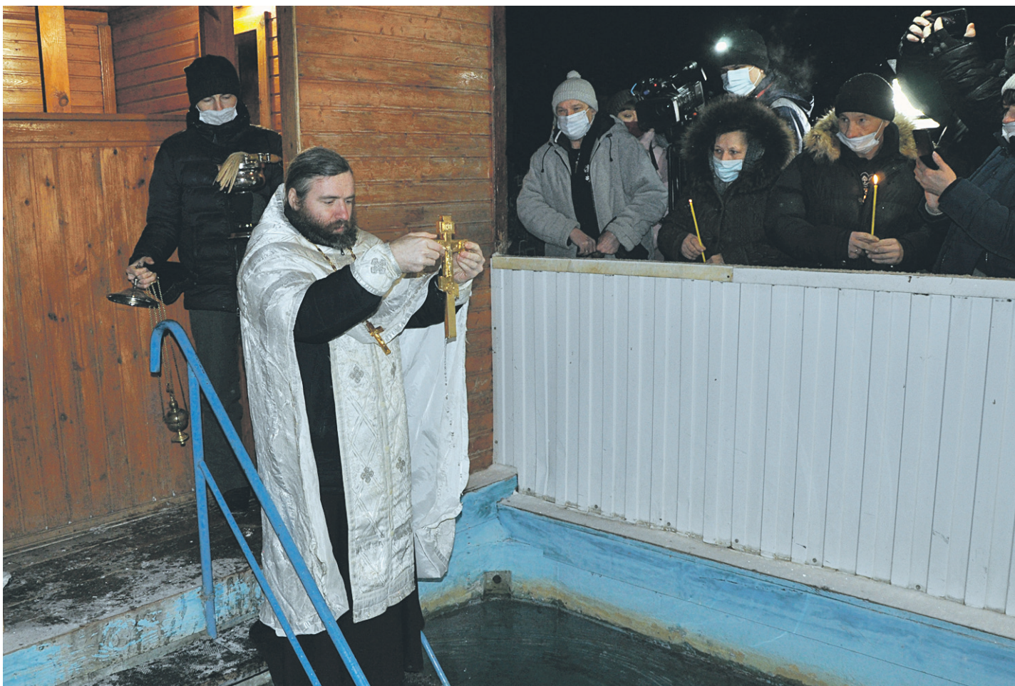
Мороз не испугал новооскольцев

ОБЩЕСТВЕННО-ПОЛИТИЧЕСКАЯ ГАЗЕТА НОВООСКОЛЬСКОГО ГОРОДСКОГО ОКРУГА Издаётся с августа 1921 года 12+