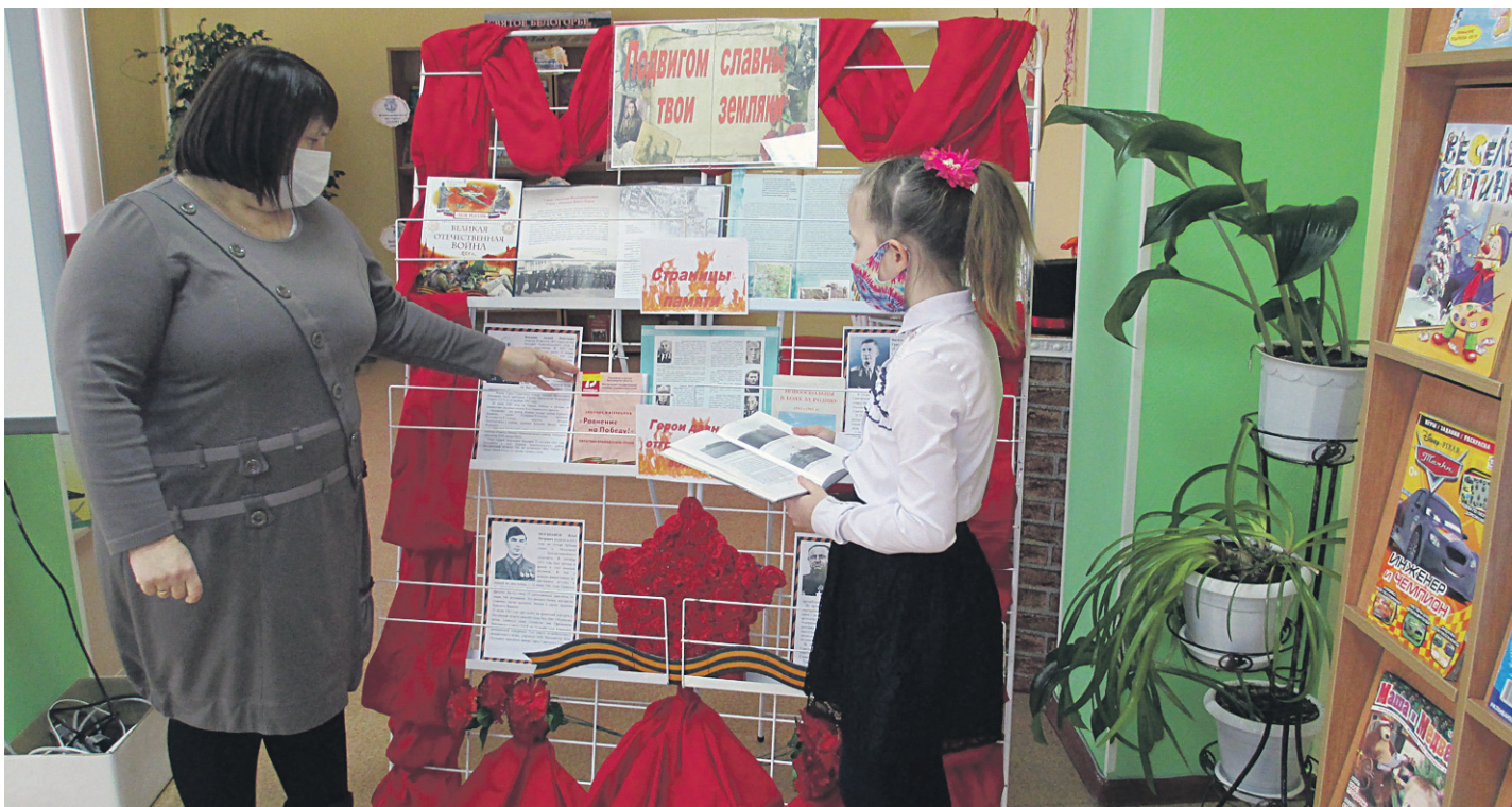
Эти книги рассказывают о подвиге людей, отстоявших честь и независимость нашей Родины

ОБЩЕСТВЕННО-ПОЛИТИЧЕСКАЯ ГАЗЕТА НОВООСКОЛЬСКОГО ГОРОДСКОГО ОКРУГА Издаётся с августа 1921 года 12+