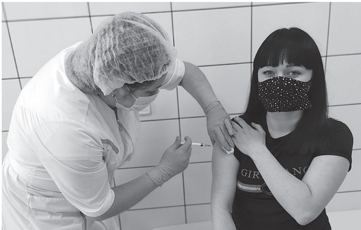
Вся процедура проходила так, как описывают в памятках

– Чувство тревоги, конечно, было, особенно за день до того, как нам нужно было выезжать. Дело в том, что я зашла в соц-