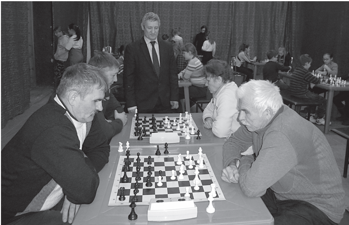
Широкий спектр увлечений ветеранов: теннис, плавание, бег, шахматы, скандинавская ходьба...