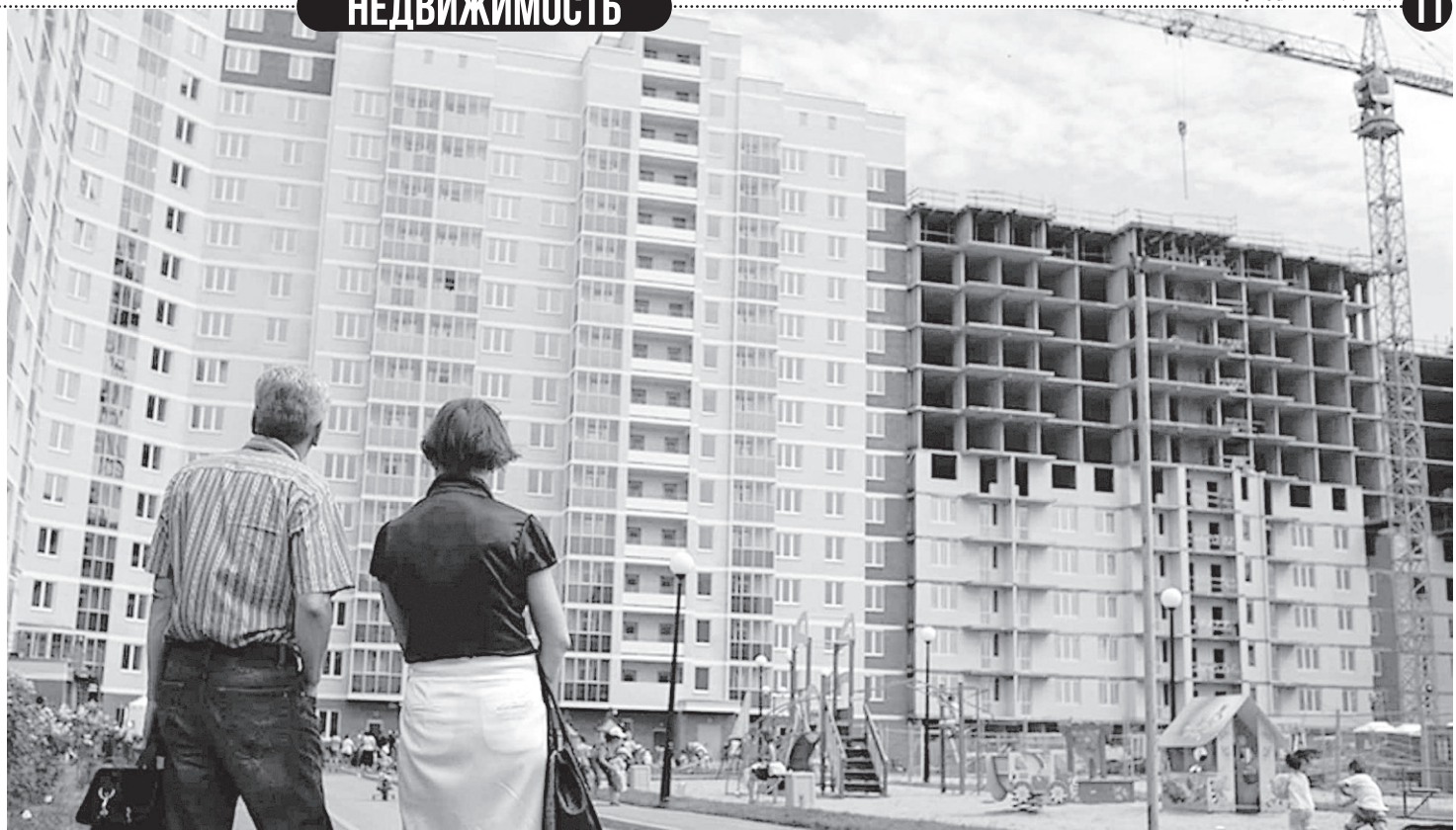
Участники долевого строительства защищены законом

Убедившись в отсутствии юридических рисков, можно заключать договор долевого участия в строительстве МКД. Договор долевого участия в строительстве МКД является правоустанавливающим документом и подлежит государственной регистрации.