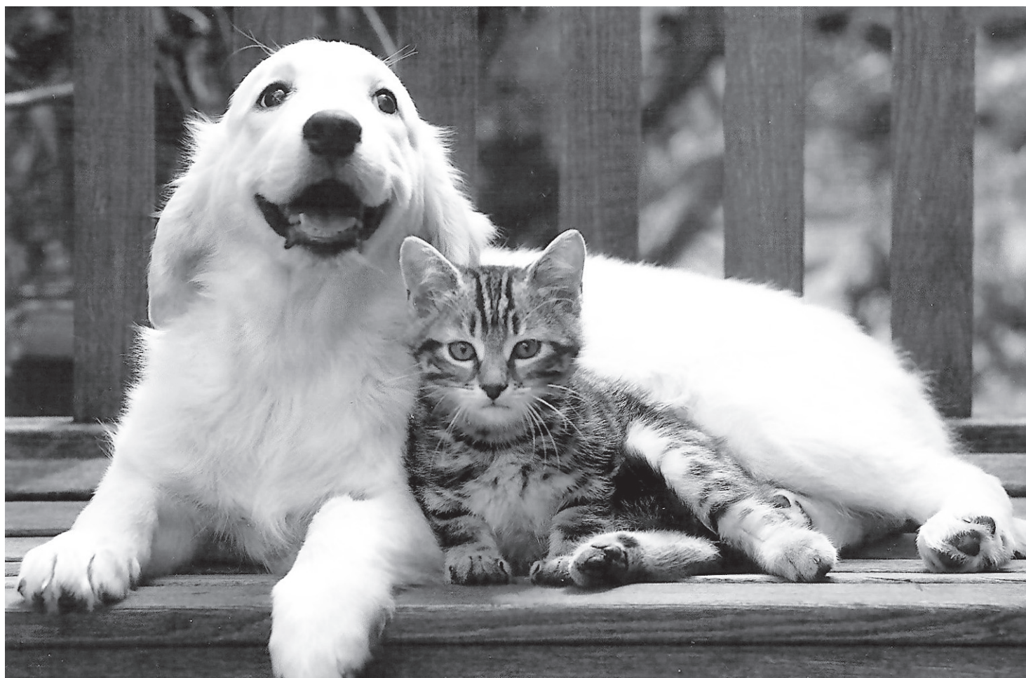
Ответственность за здоровье и содержание животных несут владельцы

Для недопущения возникновения зооантропонозных болезней, согласно плану государственных мероприятий, государственная ветеринарная служба проводит вакцинации (прививки) обработки (гиподерматоз, фасциоллёз и др.) и диагностические исследования против заразных заболеваний. Эти мероприятия обязательны для всех владельцев, кто содержит животных, независимо от формы собственности.