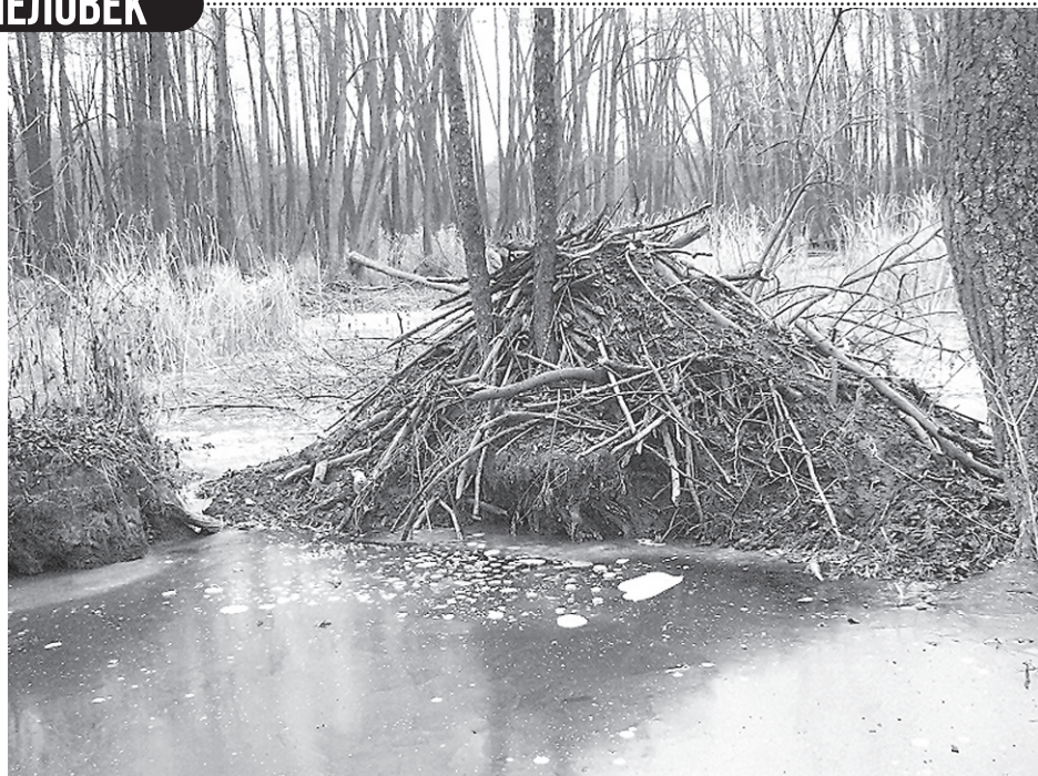
Хатка бобров. Урочище Стенки Изгорья

Также в весеннем лесу можно встретить и множество других грибов, которые не представляют интереса для грибников, их никто не собирает. Но они интересны своей причудливой формой, необычной яркой окраской. Эти грибы появляются очень рано, опережая многих своих собратьев. Ими лучше всего только любоваться и изучать специалистам.