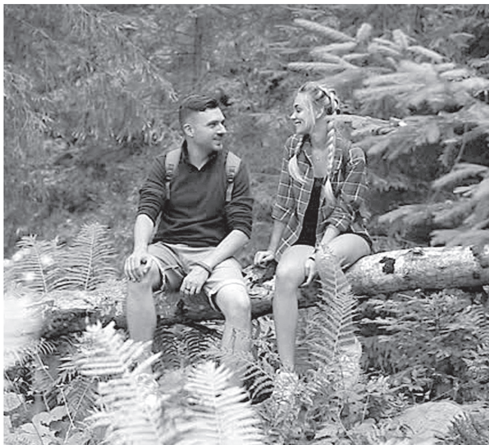
Лучший способ профилактики – защита от укусов клещей

Лучший способ профилактики клещевых инфекций – защита от укусов клещей.