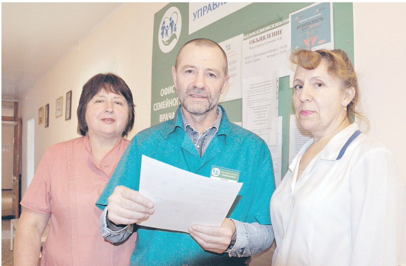
Наш девиз: «Индивидуальный подход к каждому пациенту»

ОБЩЕСТВЕННО-ПОЛИТИЧЕСКАЯ ГАЗЕТА НОВООСКОЛЬСКОГО ГОРОДСКОГО ОКРУГА Издаётся с августа 1921 года 12+