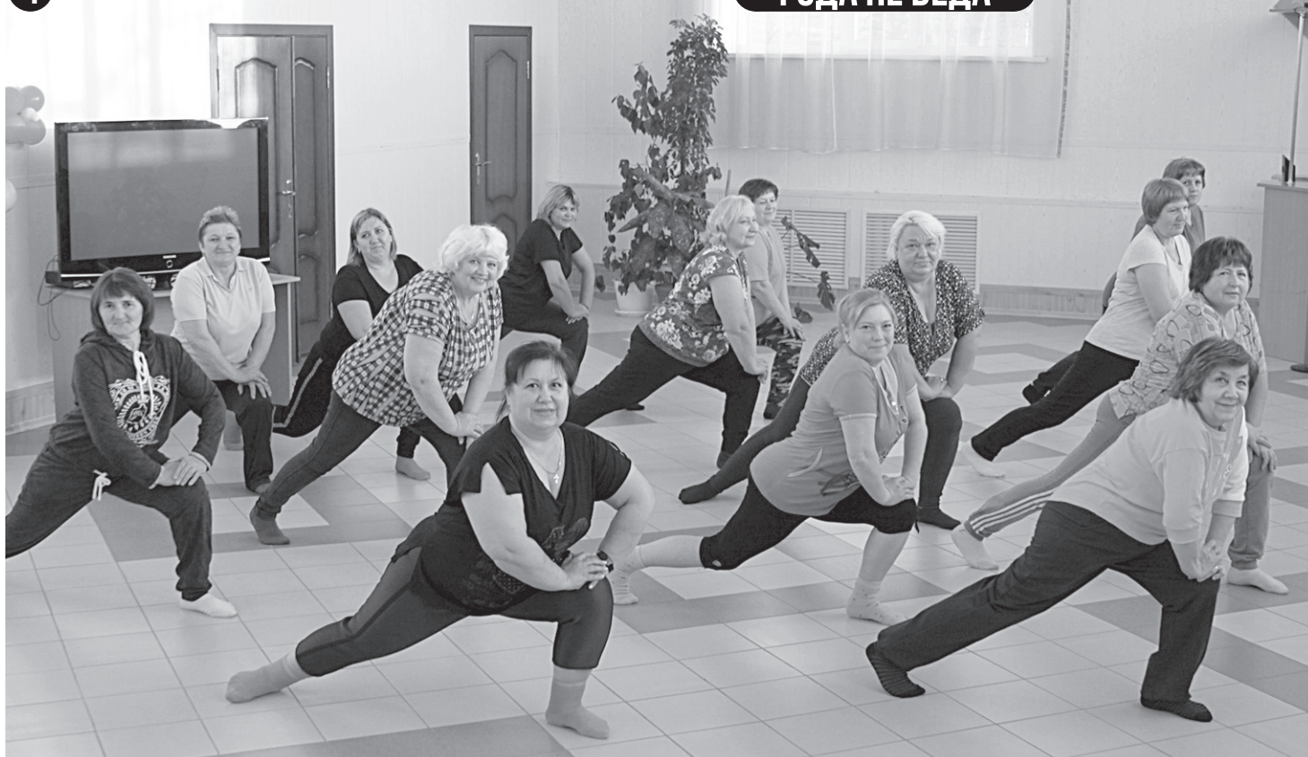
Жить – здорово!