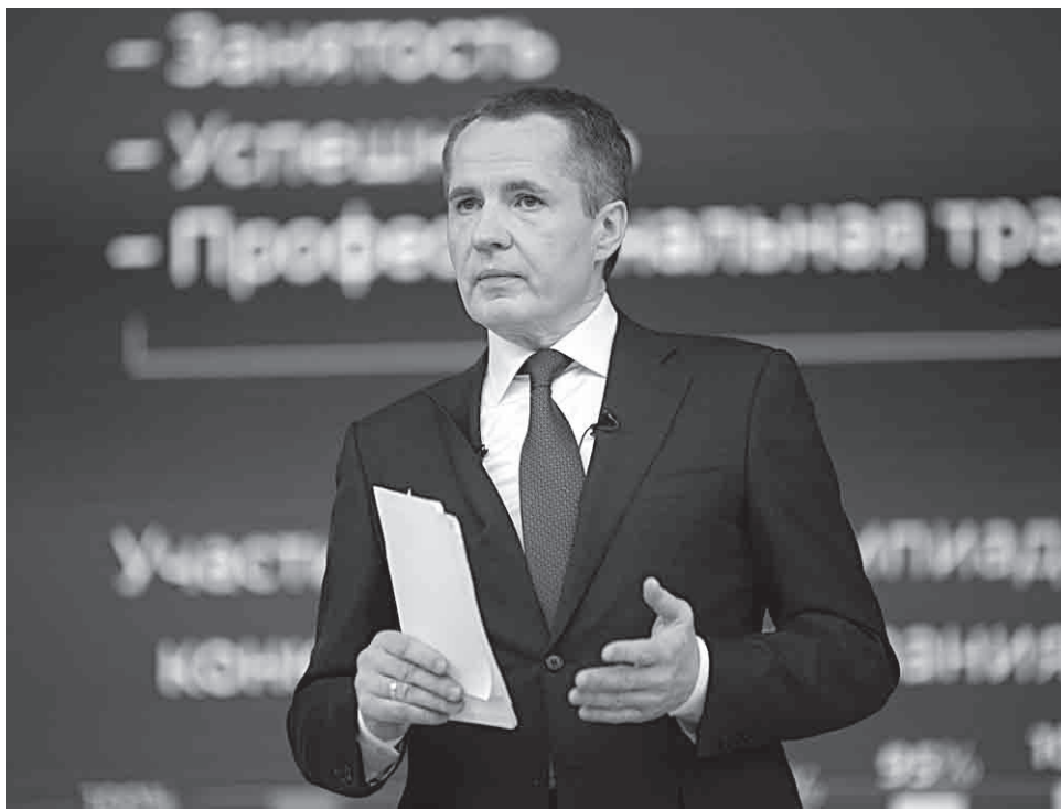
Рост качества жизни, создание комфортных условий – приоритеты для публичной власти, ее конституционная обязанность

– Выступление Вячеслава Гладкова перед областной Думой на самом деле было его посланием всем жителям Белгородской области. Крайне важно, что Вячеслав Гладков сконцентрировал свое выступление на нуждах реального, конкретного, обычного человека, живущего в регионе. Обозначил такие проблемы, как отток молодежи, необходимость развития культуры и досуга для всех жителей. Крайне важные заявления были сделаны по здравоохранению. Особенно это касается того, что не будет сокращаться количество медицинских учреждений. И надо отметить, что выступление носило стратегический характер. Не зря Вячеслав Гладков сделал отсылки к Посланию Президента РФ. Его первое поручение касалось того, что правительству региона необходимо скоординировать свою работу с теми задачами, которые поставлены Президентом страны.