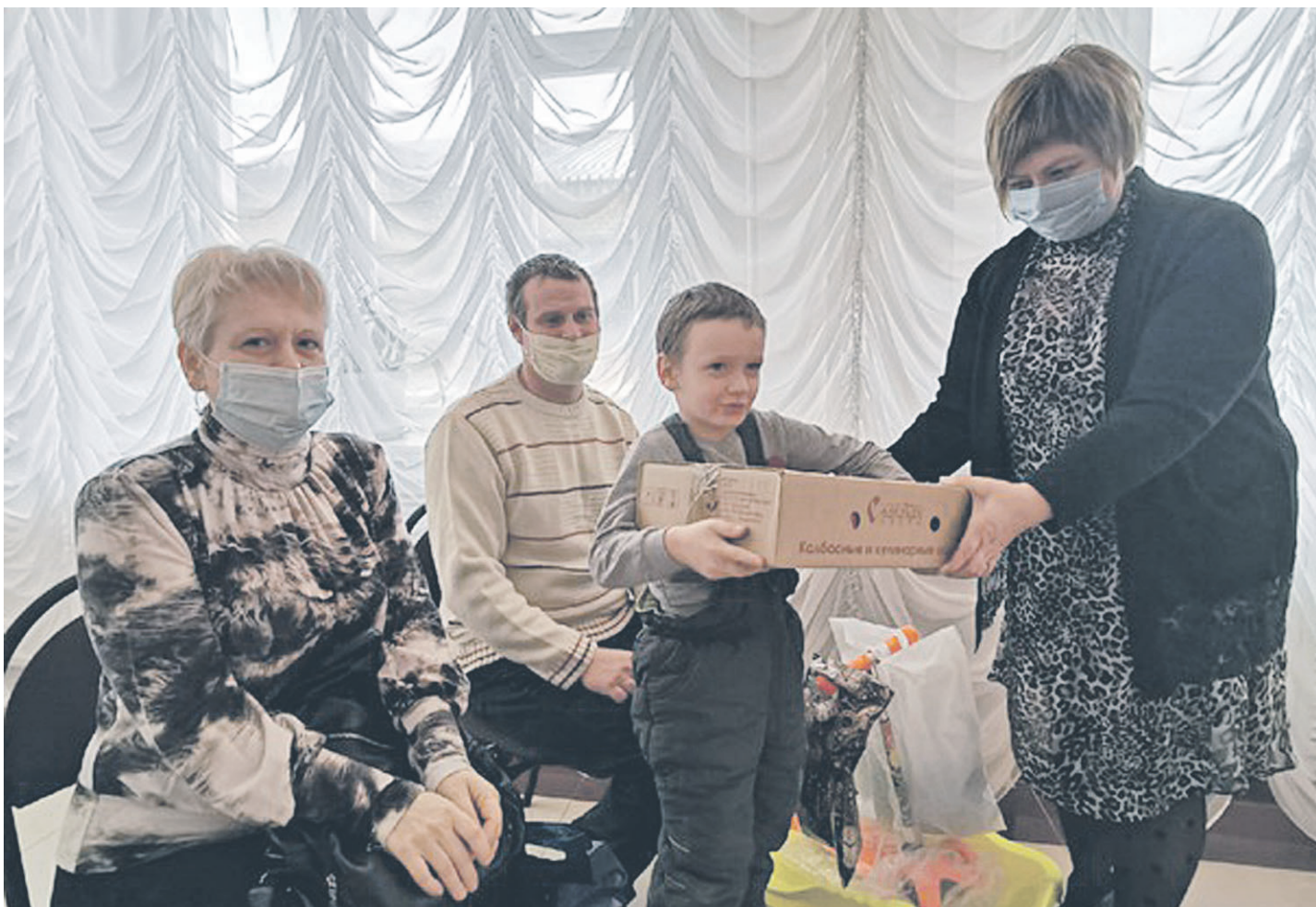
Семьи, в которых воспитывается пять и более детей, первыми получили подарки от «Единой России»

ОБЩЕСТВЕННО-ПОЛИТИЧЕСКАЯ ГАЗЕТА НОВООСКОЛЬСКОГО ГОРОДСКОГО ОКРУГА Издаётся с августа 1921 года 12+