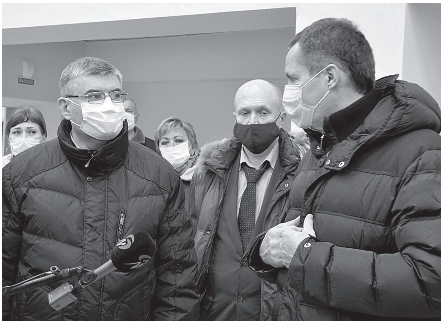
Главная цель нашей работы – улучшение качества жизни каждого человека