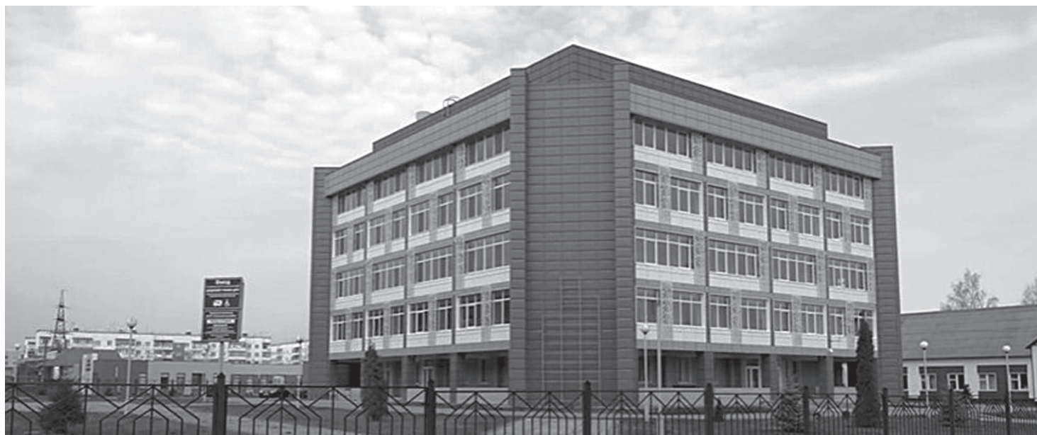
В 2021 году работа по реализации проекта «Наше общее дело» продолжится