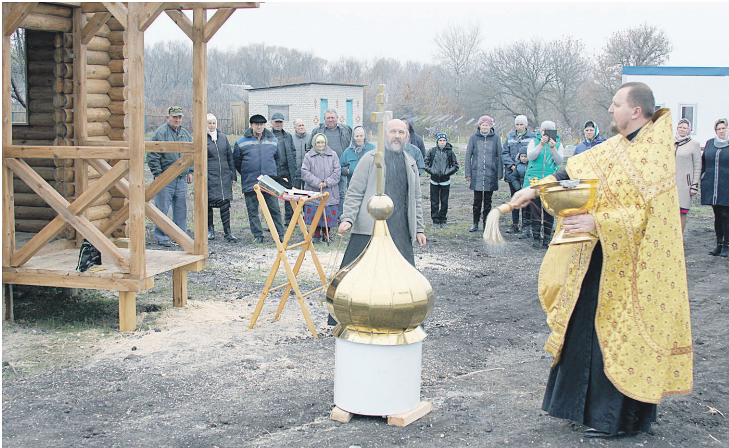
Обряд освящения надглавного креста в х. Скрынников.

ОБЩЕСТВЕННО-ПОЛИТИЧЕСКАЯ ГАЗЕТА НОВООСКОЛЬСКОГО ГОРОДСКОГО ОКРУГА Издаётся с августа 1921 года 12+