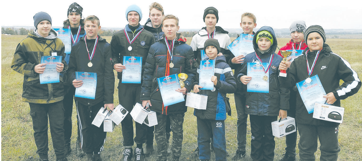
Нашим спортсменам не было равных