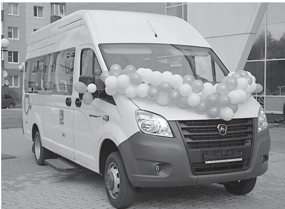
Специализированный автомобиль для доставки пожилых граждан в медучреждения