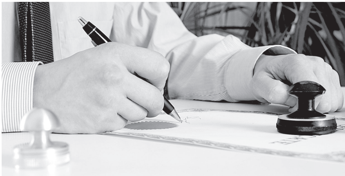
Присутствие нотариуса в сделках с недвижимостью обеспечивает их безопасность и законность