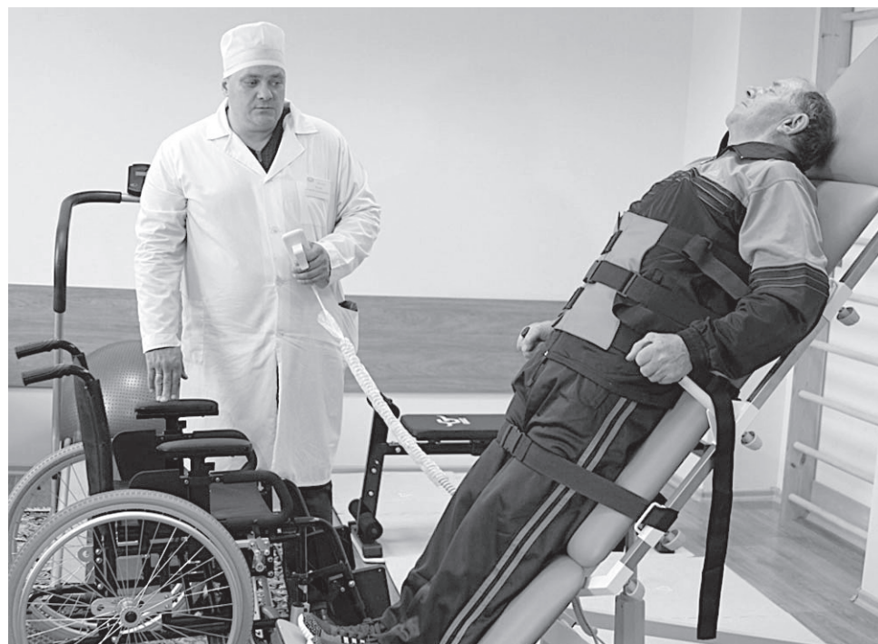
Вертикализатор нормализует кровообращение больных, помогает в реабилитации