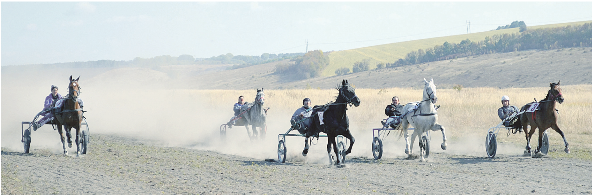
В соревнованиях, помимо хозяев, приняли участие наездники из Белгорода, Воронежской области, Корочанского, Старооскольского и Губкинского городских округов