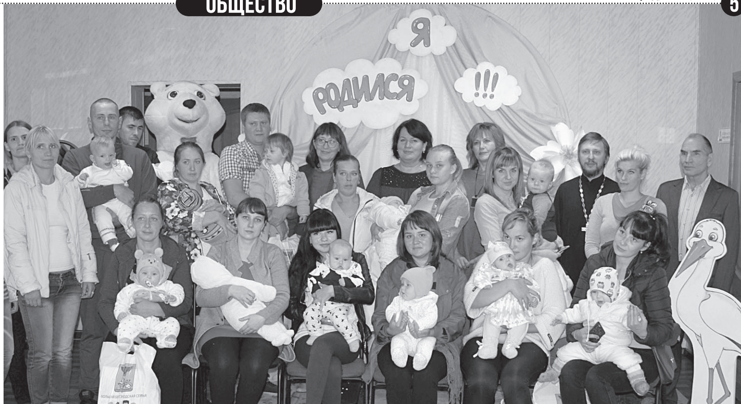
Каждая из семей, ставших родителями в 2019 году, получили полезные подарки