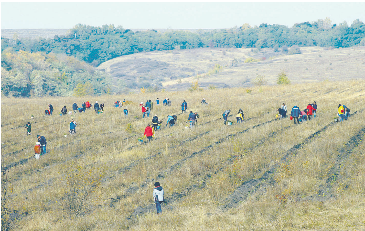
Опыт в высадке деревьев у новооскольцев немалый

ОБЩЕСТВЕННО-ПОЛИТИЧЕСКАЯ ГАЗЕТА НОВООСКОЛЬСКОГО ГОРОДСКОГО ОКРУГА Издаётся с августа 1921 года 12+