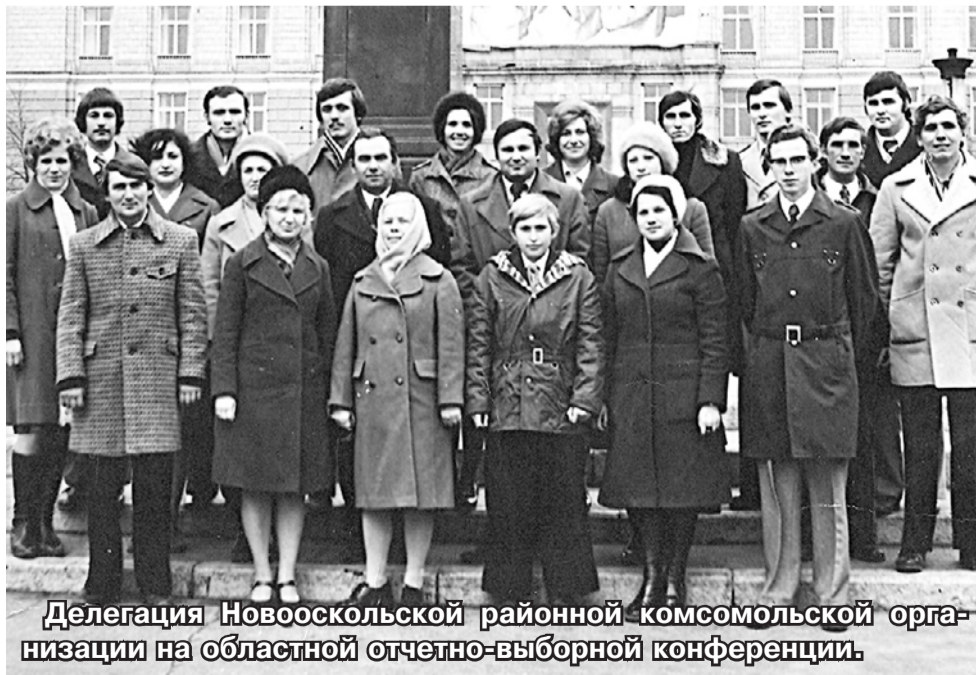
Делегация Новооскольской районной комсомольской организации на областной отчетно-выборной конференции.