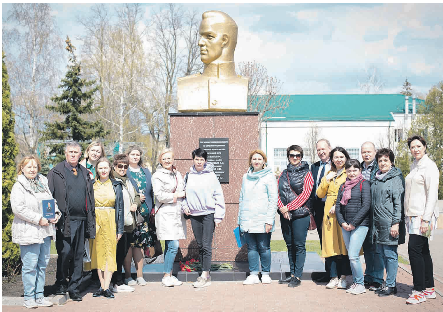
Делегация журналистов Южного Урала возложила цветы к памятнику генералу А. С. Костицину.

Вперёд Учредители: Департамент внутренней и кадровой политики Белгородской области; Администрация Новооскольского городского округа; Совет депутатов Новооскольского городского округа; АНО «Редакция газеты «Вперёд».