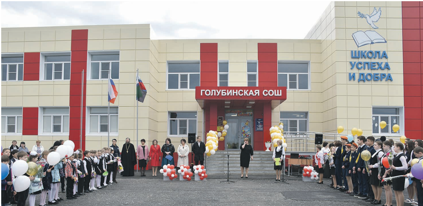
Торжественная линейка в Голубинской СОШ

ОБЩЕСТВЕННО-ПОЛИТИЧЕСКАЯ ГАЗЕТА НОВООСКОЛЬСКОГО ГОРОДСКОГО ОКРУГА Издаётся с августа 1921 года 12+