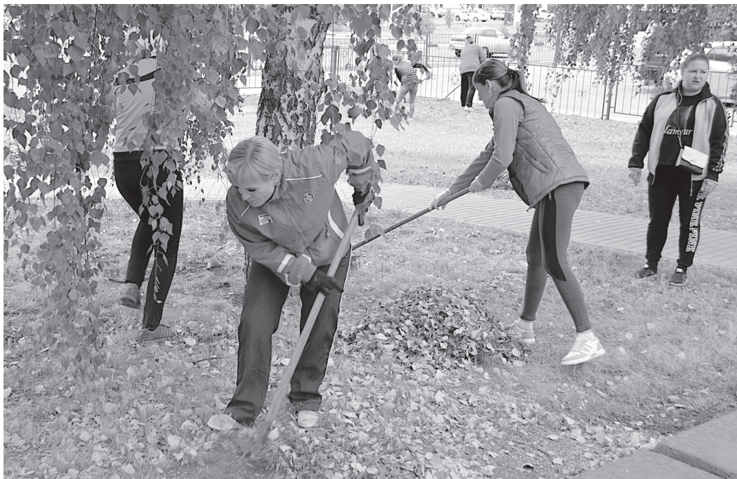
Вместе с волонтерами участие в акции приняли жители городского округа

Конкурс проводился по десяти номинациям, в которых победителями стали 13 предприятий региона.