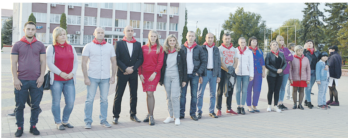
34 новооскольца стали потенциальными донорами костного мозга

ОБЩЕСТВЕННО-ПОЛИТИЧЕСКАЯ ГАЗЕТА НОВООСКОЛЬСКОГО ГОРОДСКОГО ОКРУГА Издаётся с августа 1921 года 12+