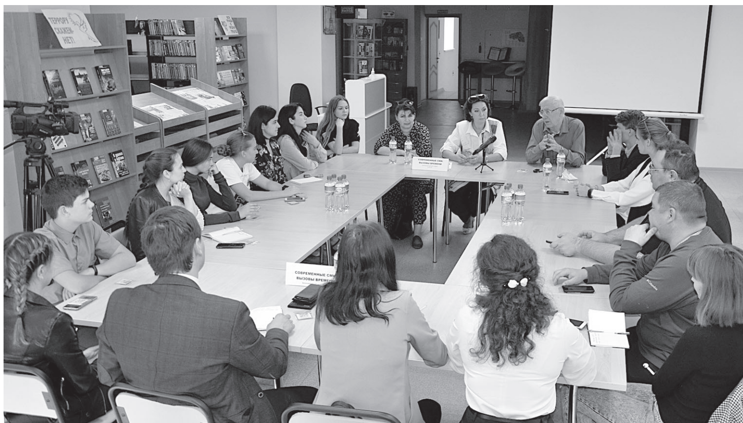
Общение было интересным и познавательным

– По тому же сценарию, что и тридцать лет назад в Нагорном Карабахе, западные СМИ освещали и «революцию достоинства» 2014 года на Украине, и последние события в Белоруссии, используя