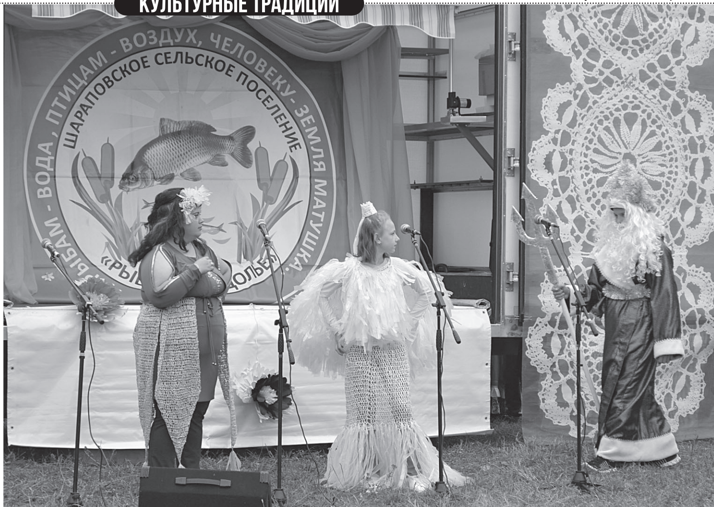
«Рыбное раздолье» село Шараповка

Впрочем, ни зябнуть, ни скучать здесь никто не собирался, да, если честно, и не смог бы – настолько зазорным и зажигательным оказалось театрализованное представление, подготовленное шараповскими артистами. Изящная Золотая Рыбка, очаровательная Кикимора и величест-