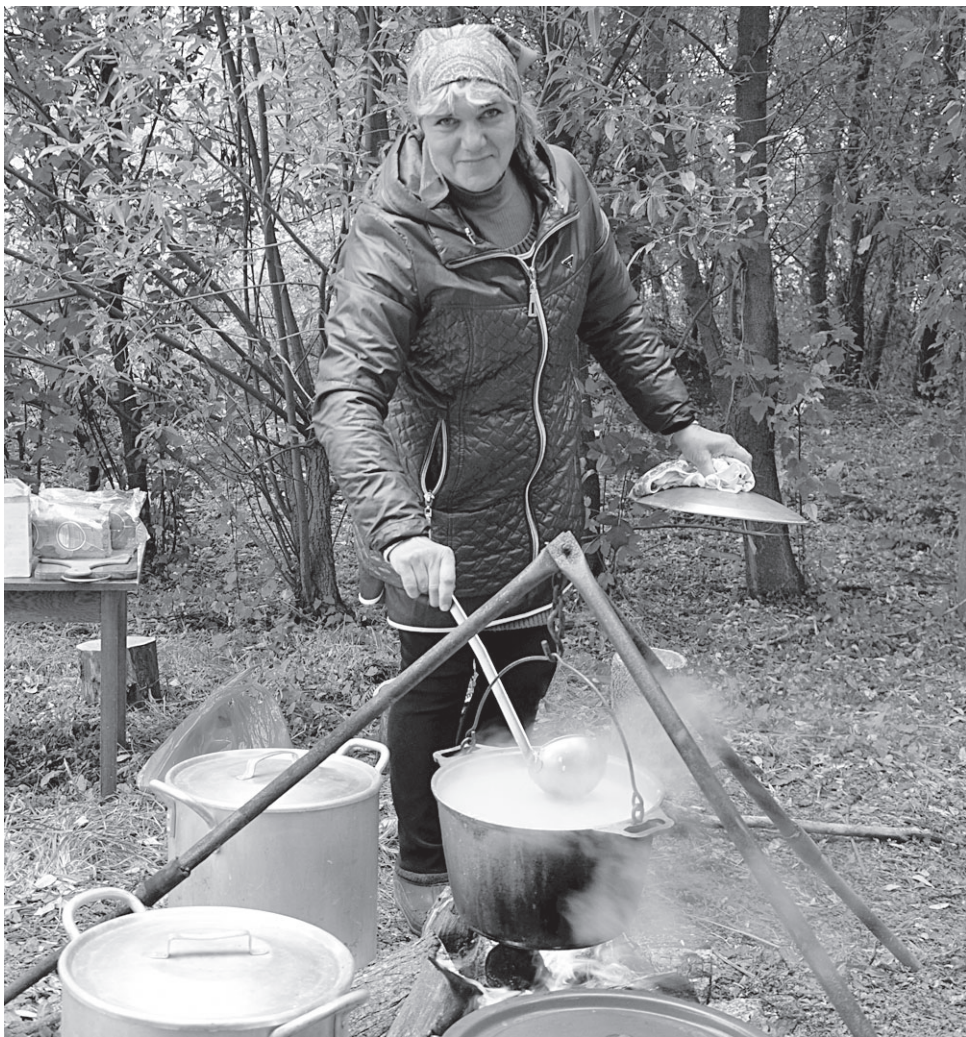
Всех желающих угощали горячим кулешом и ароматным чаем

А ещё, как обычно, очень яркой и многонациональной оказалась концертная программа, подготовленная лучшими артистами Новооскольского городского округа. Не менее оригинальными были и выставки мастеров декоративно-прикладного творчества. На «Ярмарке национальной кухни» можно было не только отведать самые разные «фирменные» национальные блюда, но и узнать секре-