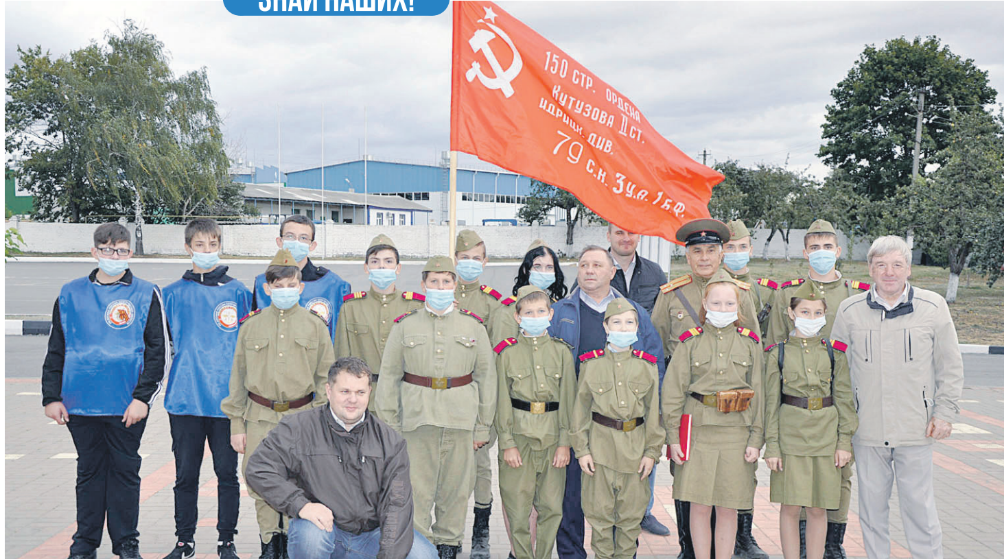
Гости высоко оценили работу по патриотическому воспитанию молодёжи в Новооскольском городском округе.

В марш-броске лучшими стали курсанты ВПК «Север» им. Героя России В. М. Воробьева из п. Северный Белгородского района. Также в тройку лидеров вошли команды из Белгорода и Прохоровки.