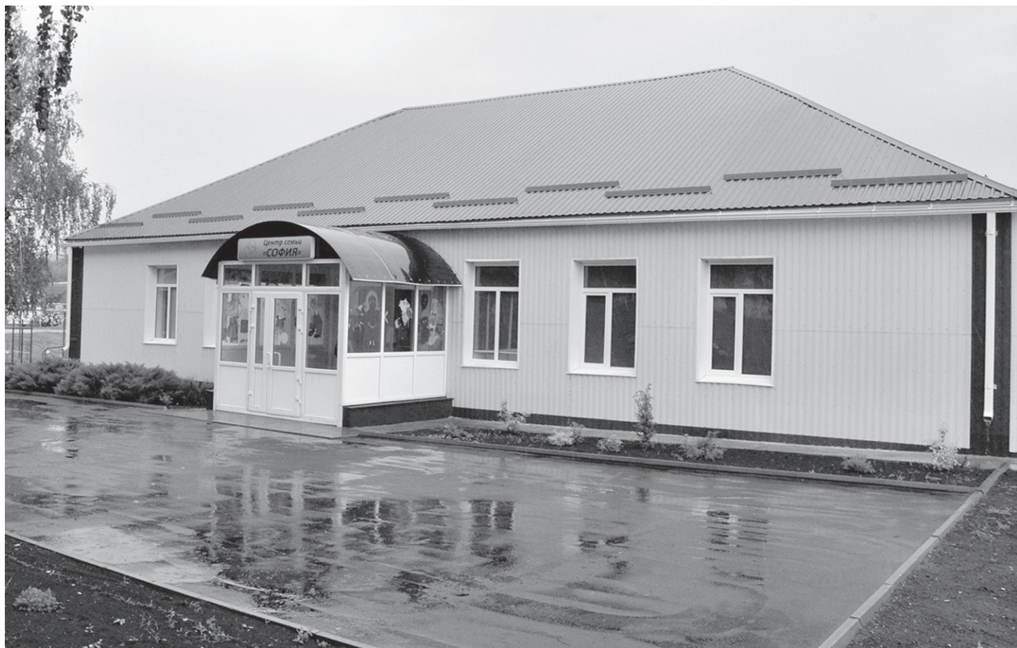
В рамках реализации национального проекта «Демография» два года назад на базе комплексного центра социального обслуживания населения Новооскольского городского округа был открыт и ведет свою деятельность центр семьи «София»