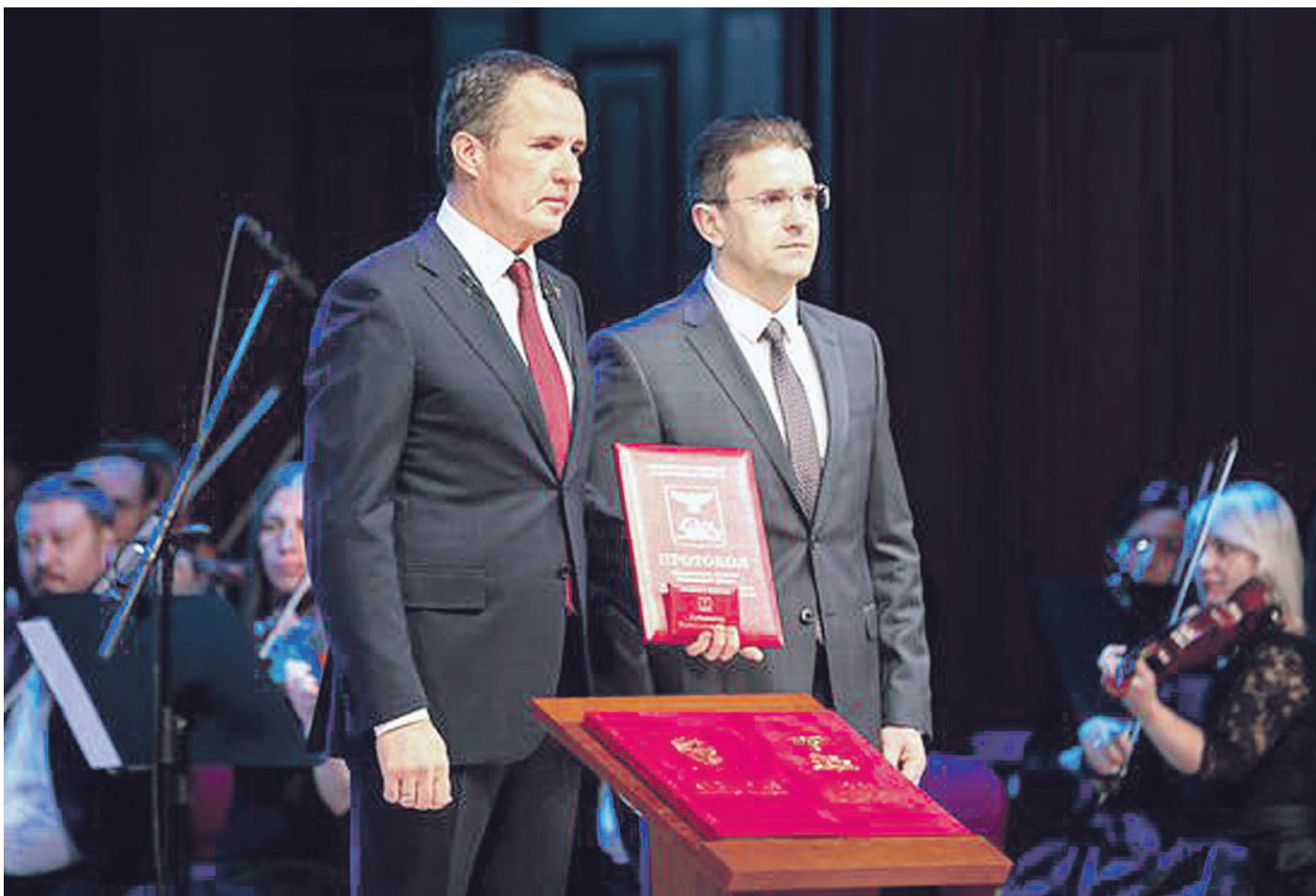
Торжественная церемония прошла 27 сентября в белгородской филармонии.

ОБЩЕСТВЕННО-ПОЛИТИЧЕСКАЯ ГАЗЕТА НОВООСКОЛЬСКОГО ГОРОДСКОГО ОКРУГА Издаётся с августа 1921 года 12+