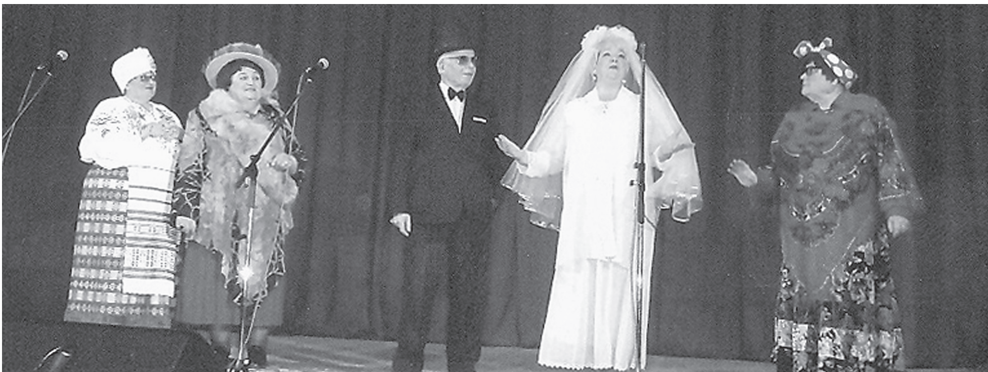
Коллектив «Супербабушки и дед»: «Силы черпаем из нашего творчества...»