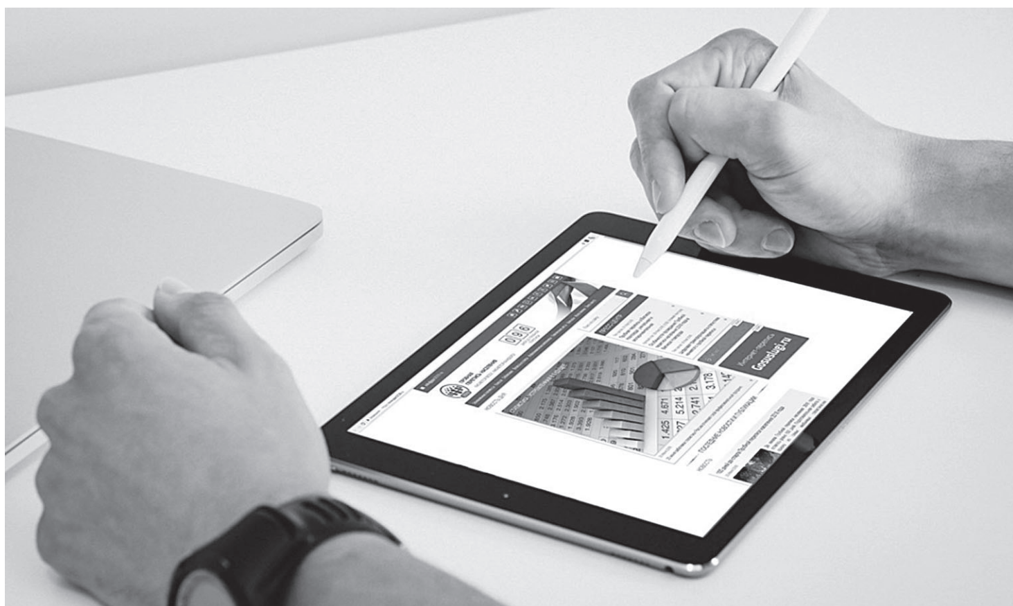
Пользоваться планшетом несложно – цифровые подсказки помогут заполнить анкету на экране

Отделение по Белгородской области Главного управления Банка России по Центральному федеральному округу.