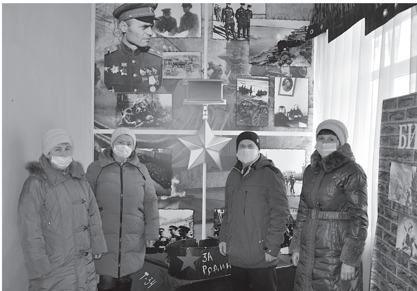
Боровогринёвские краеведы – люди, которые по крупицам воссоздают страницы истории родного села