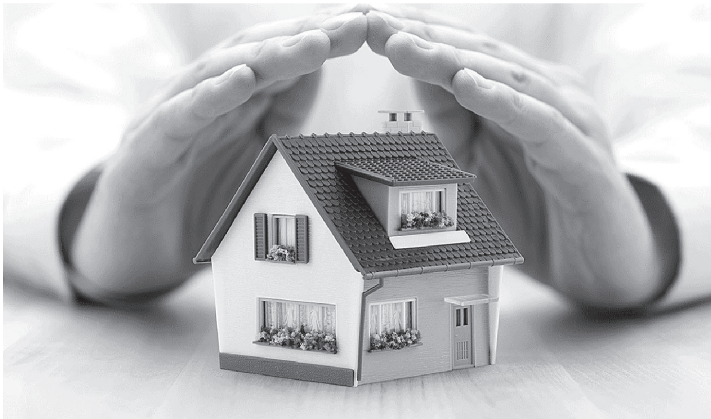
За 10 месяцев текущего года в сведения ЕГРН была внесена 1431 запись о невозможности государственной регистрации права без личного участия собственника

Страница подготовлена по материалам Управления Росреестра по Белгородской области.