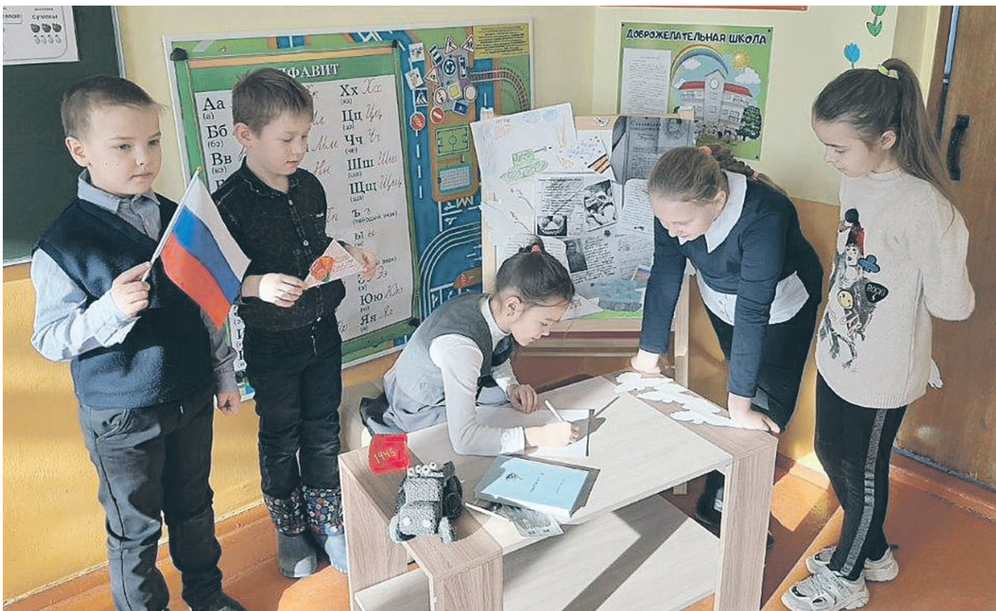
Новооскольские школьники поздравили ветеранов с Днём защитника Отечества

ОБЩЕСТВЕННО-ПОЛИТИЧЕСКАЯ ГАЗЕТА НОВООСКОЛЬСКОГО ГОРОДСКОГО ОКРУГА Издаётся с августа 1921 года 12+