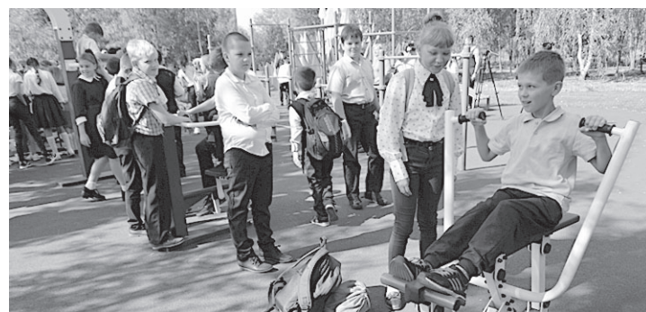
Новый спортивный объект станет прекрасным подспорьем для будущих чемпионов