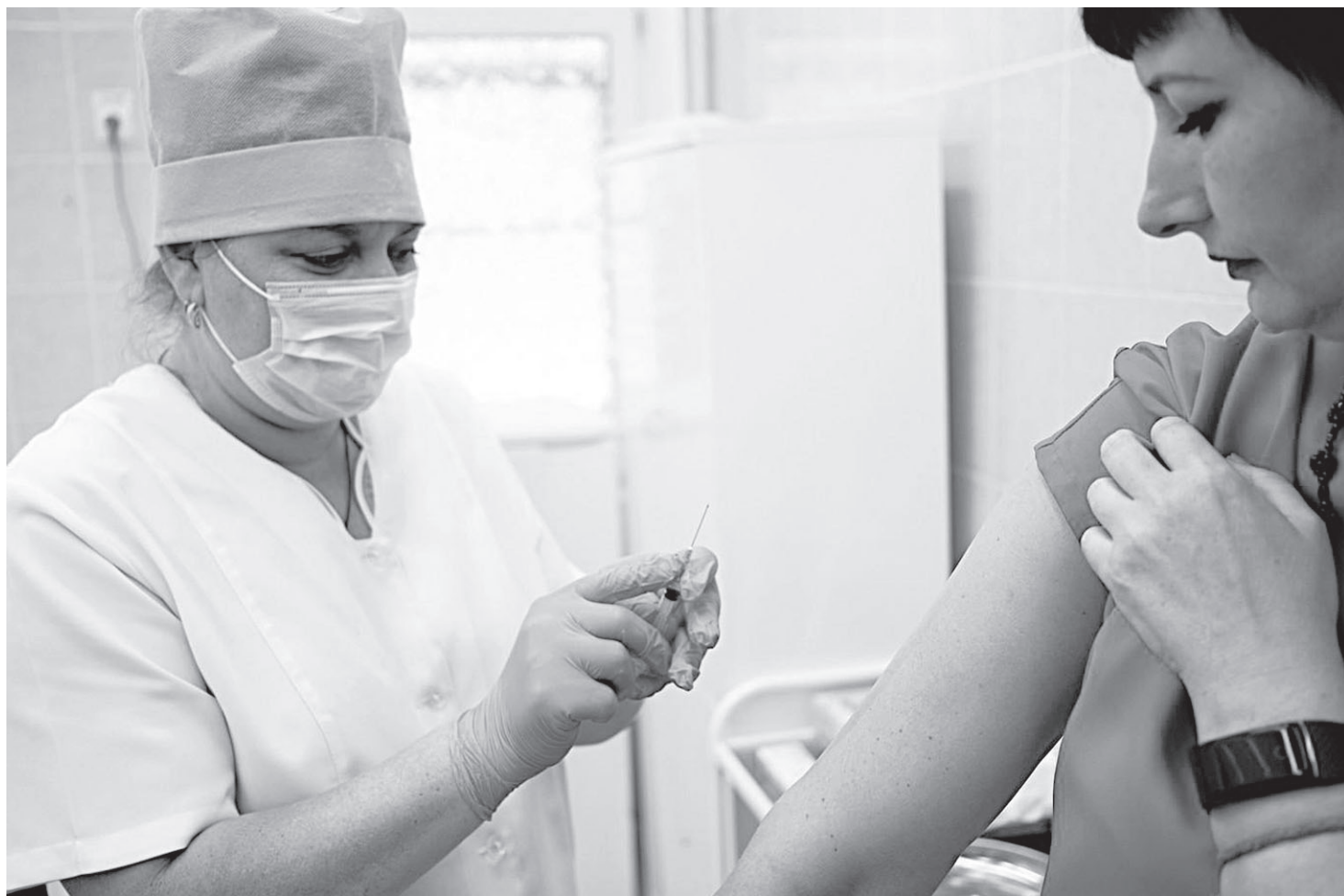
Если привитый человек и заболел гриппом, он защищен от тяжелых осложнений и заболевание протекает гораздо легче

Многие родители отказываются ставить прививку от гриппа детям, считая, что вакцина может нанести вред здоровью, и от нее нет пользы. Это миф: на самом деле прививка не опасна и не вызывает осложнений, в крайнем случае может проявиться покраснение на коже в мес-