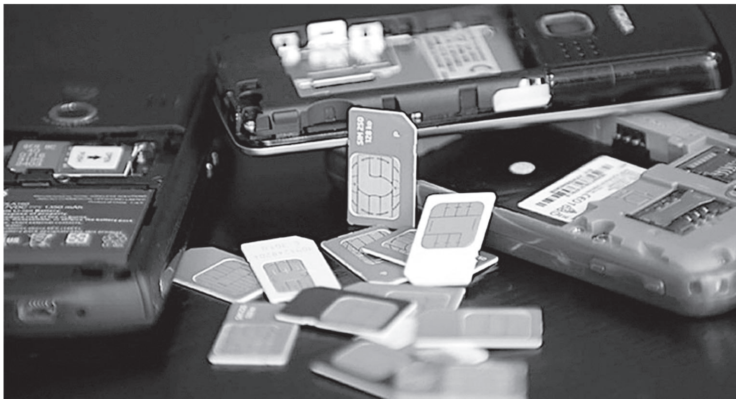
Номер для переноса должен быть оформлен на абонента, который подаёт заявку

Управление Пенсионного фонда Российской Федерации в Новооскольском городском округе Белгородской области.