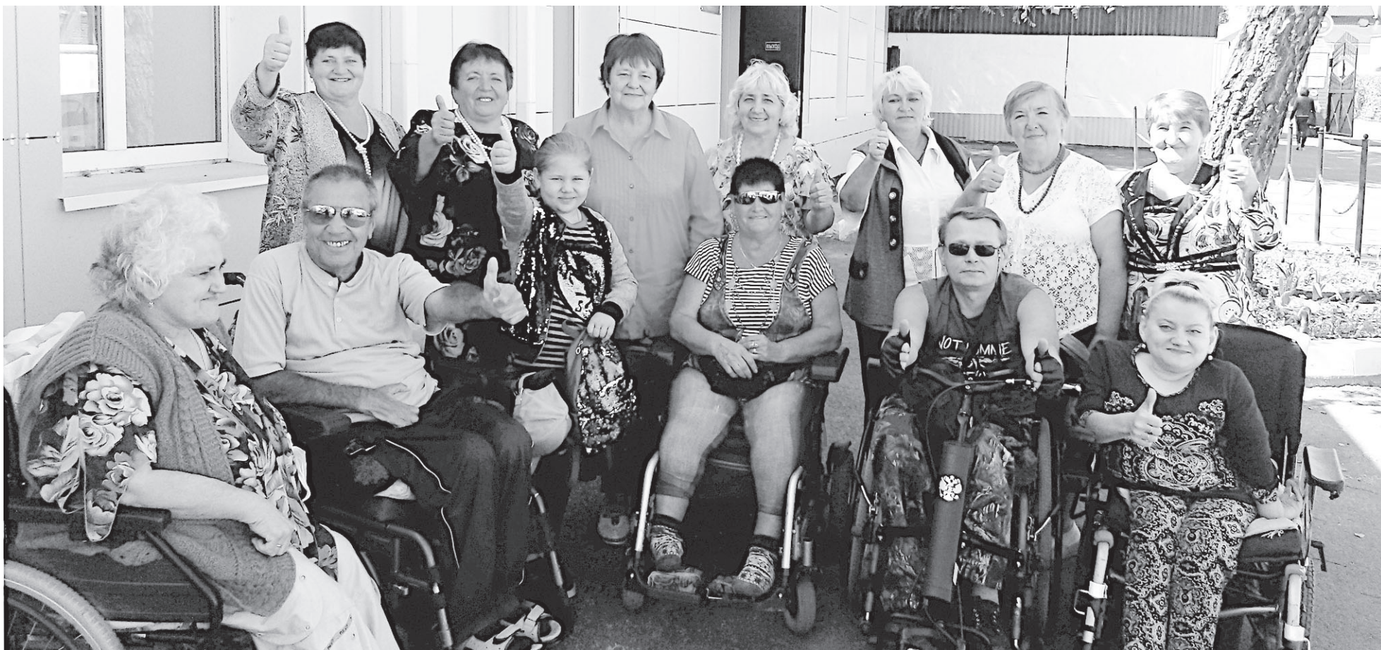
Стараемся своим примером поддержать других