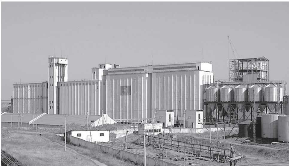
Удельный вес АО «Приосколье» в стоимости валовой продукции сельхозпредприятий за 9 месяцев 2019 года составил 75% или 11 млрд рублей