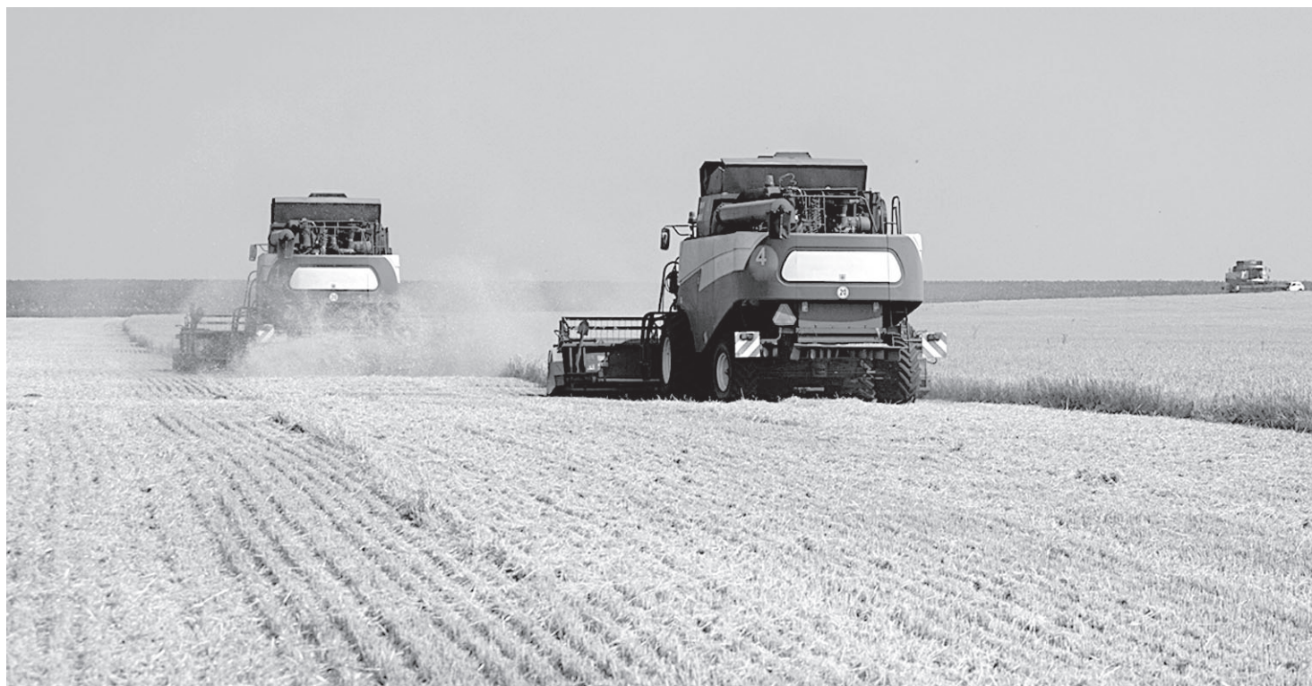
В текущем году получен рекордный урожай зерна

● ПОДВОДЯ ИТОГИ СЕЛЬСКОХОЗЯЙСТВЕННОГО ГОДА