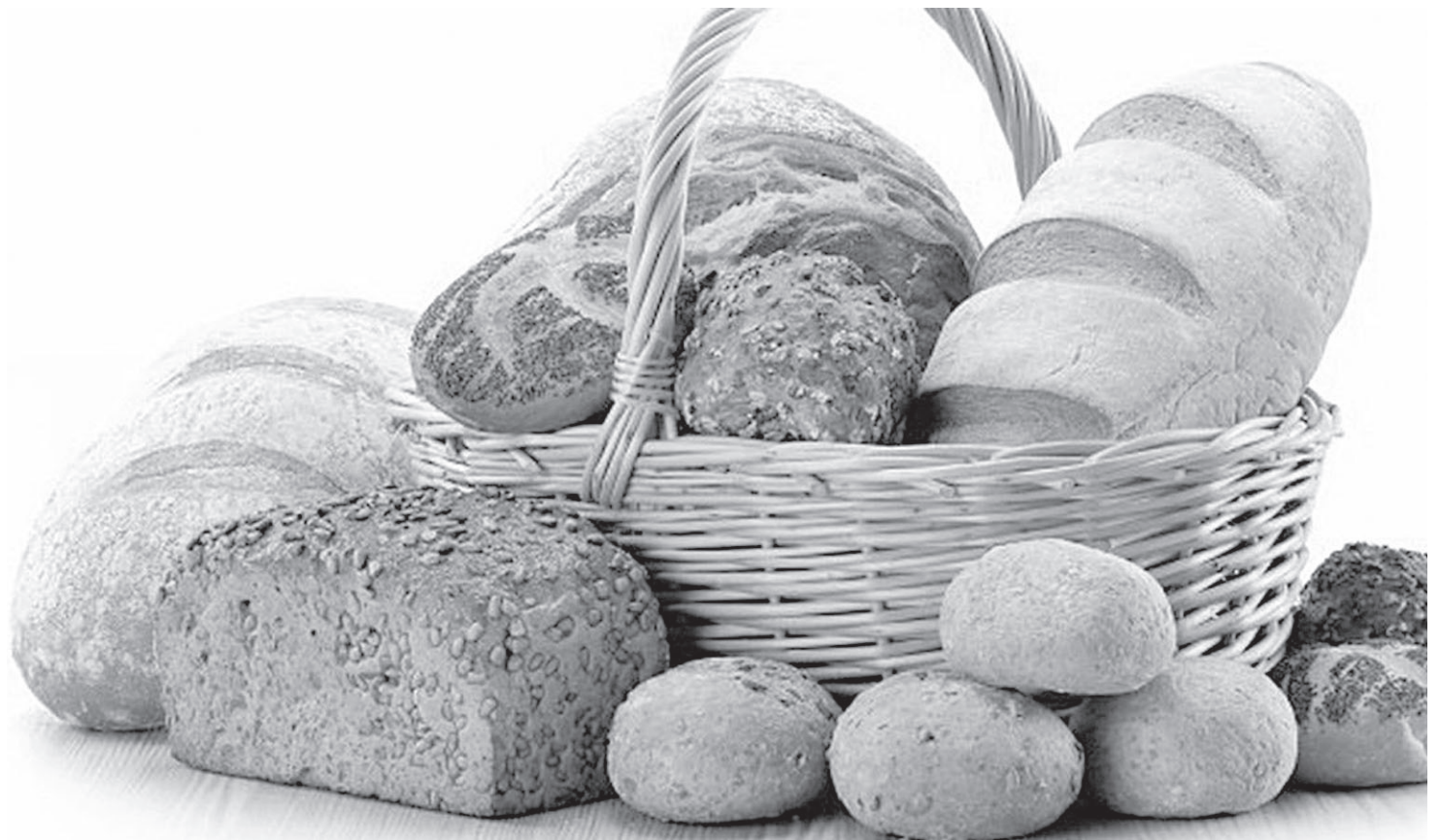
С вступлением новых ГОСТов производители будут обязаны использовать только качественную хлебопекарную муку