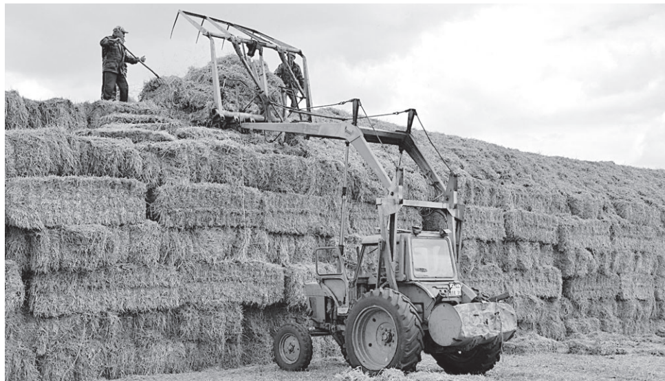
Более 50% работающего населения трудятся в агропромышленном комплексе