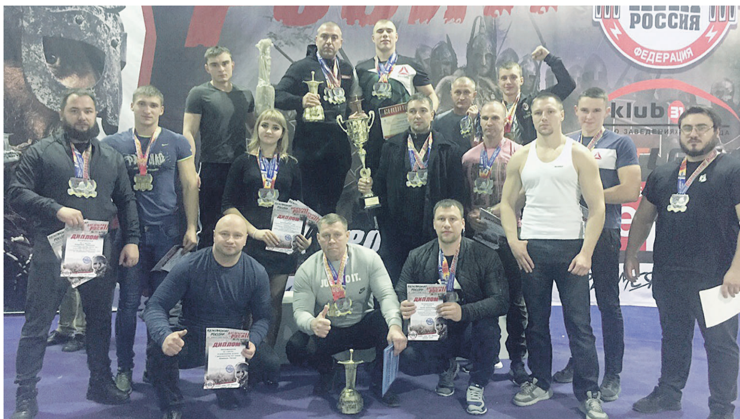
Новооскольский городской округ на турнире представляли команды «Титан» и «Кадеты»

Пресс-служба администрации Новооскольского городского округа.