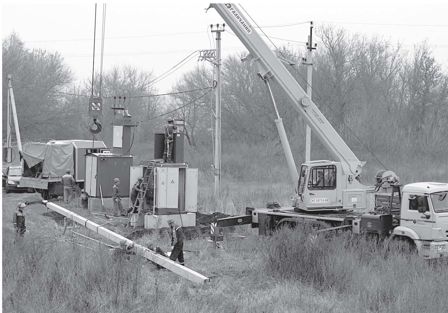
Энергетика даёт возможность чувствовать себя комфортно