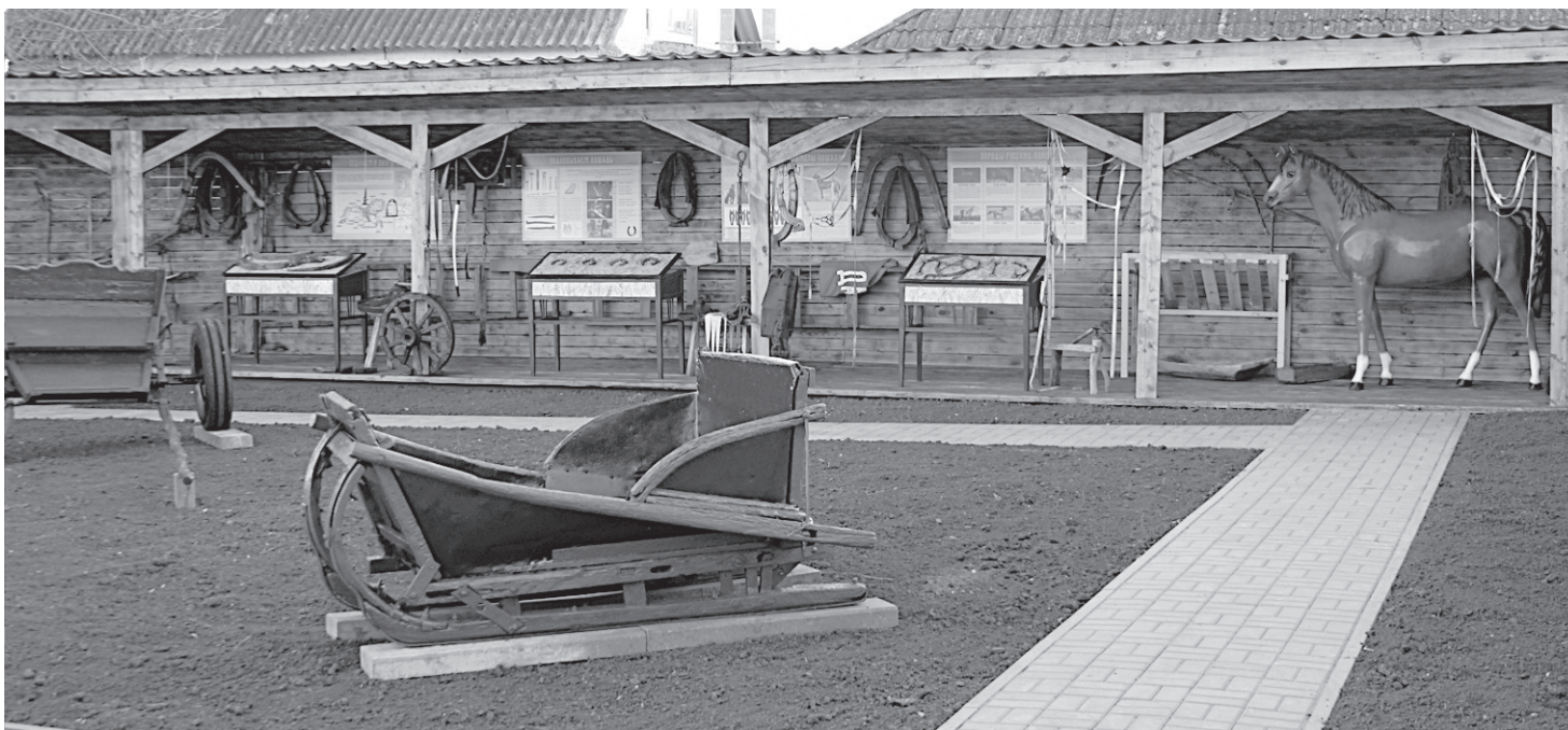
Экспозиция музея имени Первой Конной армии

кладного искусства в сельский Дом культуры. Там же некоторое время работала культорганизатором и по совместительству – вожатой в школе. При моем непосредственном участии реализован проект создания Дома гуся, я была его директором. Сейчас это – раскрученный туристический бренд, визитная карточка села Богородское. Возглавить музей Первой конной армии мне предложили в феврале 2018 года. После недолгих колебаний я согласилась, так как это творческая работа, которая мне по душе. Приняла музей я после капитального ремонта, можно сказать, в отличном состоянии. Все,