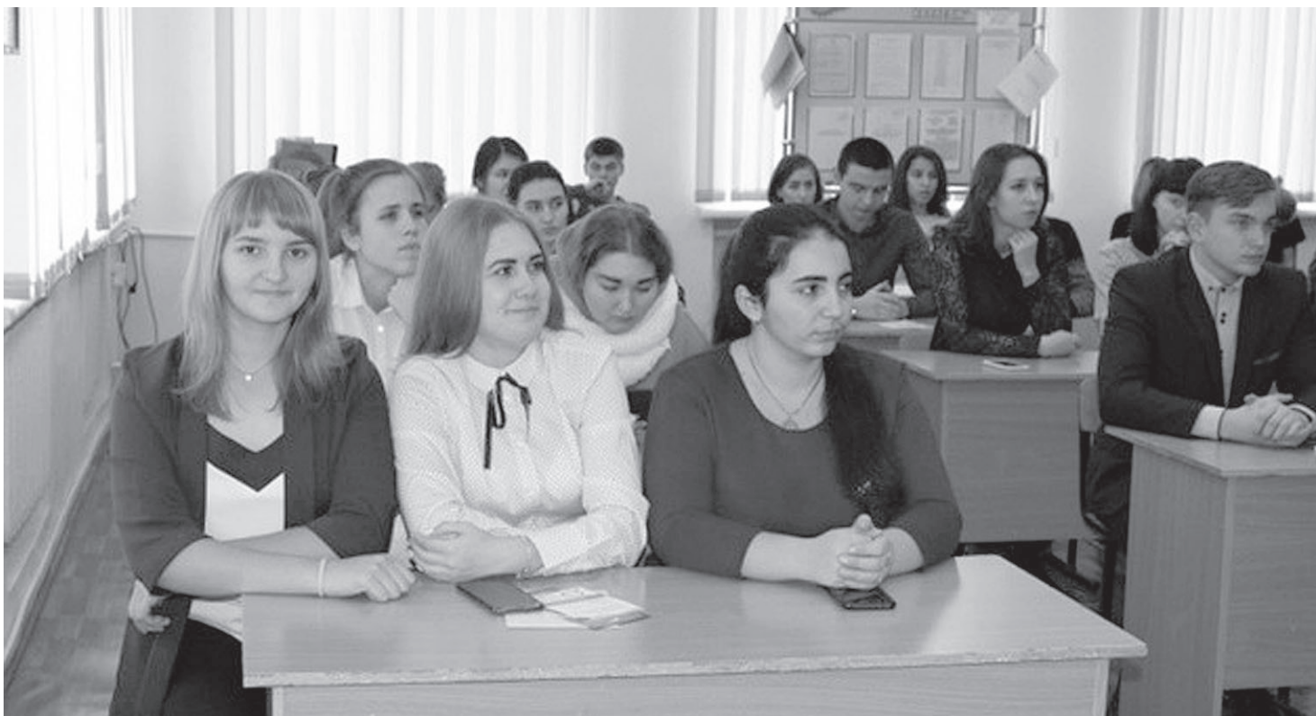
Легко ли это – найти профессию своей мечты?