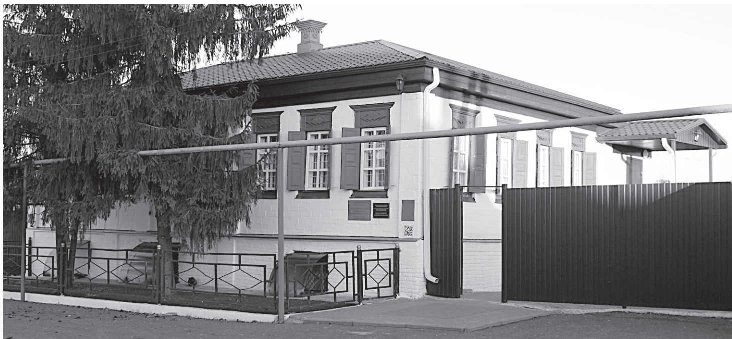
Двери музея всегда распахнуты для посетителей

ХОЧЕШЬ СТАТЬ УЧАСТНИКОМ ПРОЕКТА? ЗВОНИ: 8(47233)4-55-65. ПРИХОДИ: Г. НОВЫЙ ОСКОЛ, УЛ. СЛАВЫ, 39. РЕДАКЦИЯ ГАЗЕТЫ «ВПЕРЕД».