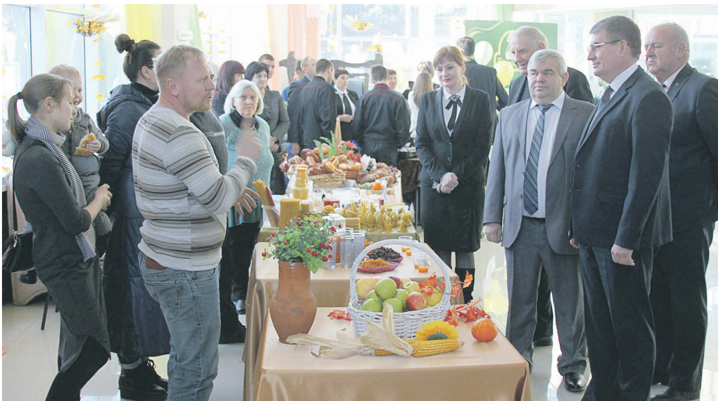
На выставке было представлено всё многообразие производимой сельскохозяйственной продукции

ОБЩЕСТВЕННО-ПОЛИТИЧЕСКАЯ ГАЗЕТА НОВООСКОЛЬСКОГО ГОРОДСКОГО ОКРУГА Издаётся с августа 1921 года 12+