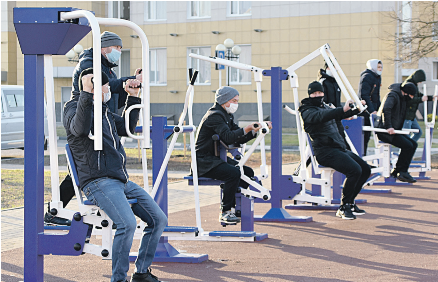
Новая спортивная площадка – стимул к занятиям физической культурой и спортом

ОБЩЕСТВЕННО-ПОЛИТИЧЕСКАЯ ГАЗЕТА НОВООСКОЛЬСКОГО ГОРОДСКОГО ОКРУГА Издаётся с августа 1921 года 12+