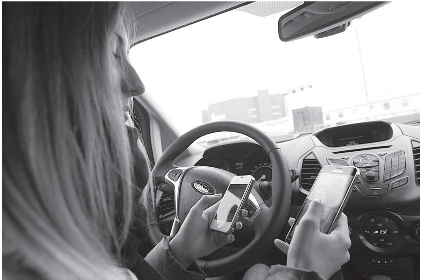
Разговаривать по мобильнику во время движения водителю можно. Нельзя держать телефон в руках.

Использование мобильных телефонов за рулем – действительно опасно. Особенно, если водитель не разговаривает по нему, а пишет СМС или общается в соцсетях. Немецкие ученые провели эксперимент и установили, что если водитель пишет на ходу СМС, то его поведение гораздо опаснее, чем у человека, который выпил 200 граммов водки.