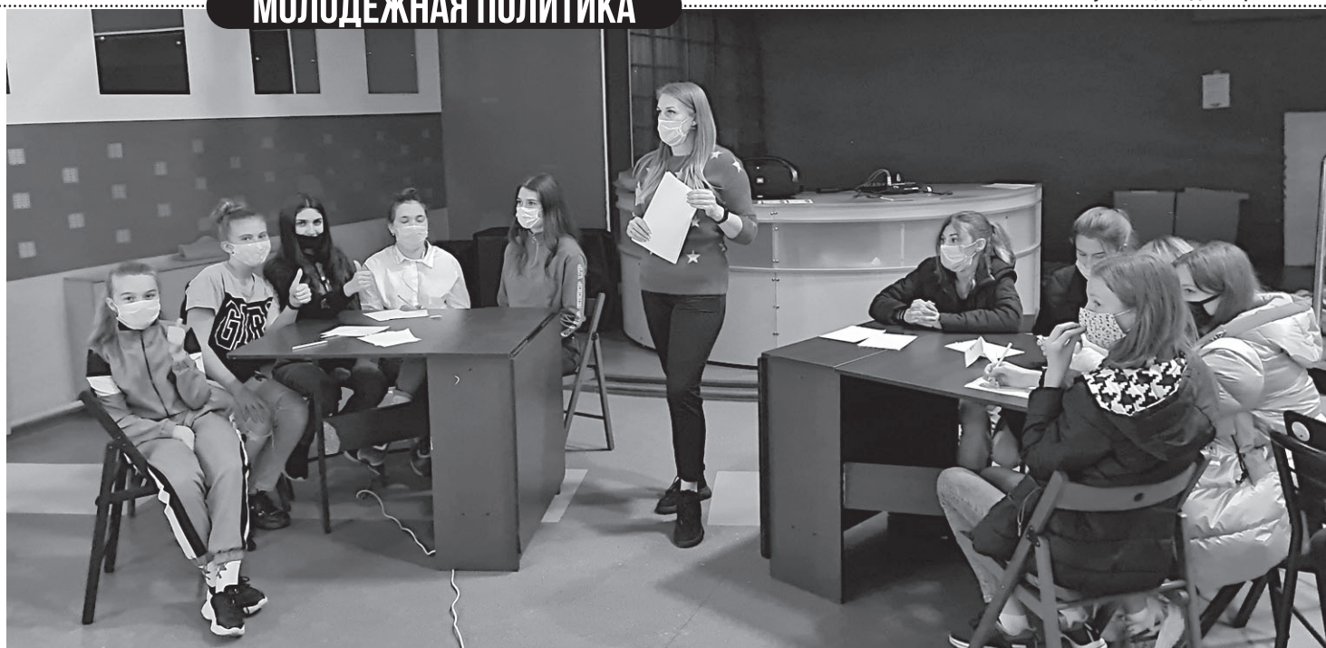
Активисты РСМ и МГЕР Новооскольского городского округа на игре «РосКвиз».

В целях предупреждения экстремистских проявлений в молодежной среде специалистами Центра молодежных инициатив совместно с представителями общественных и спортивных организаций, образовательными учреждениями на постоянной основе проводится информационно-просветительская работа по форми-