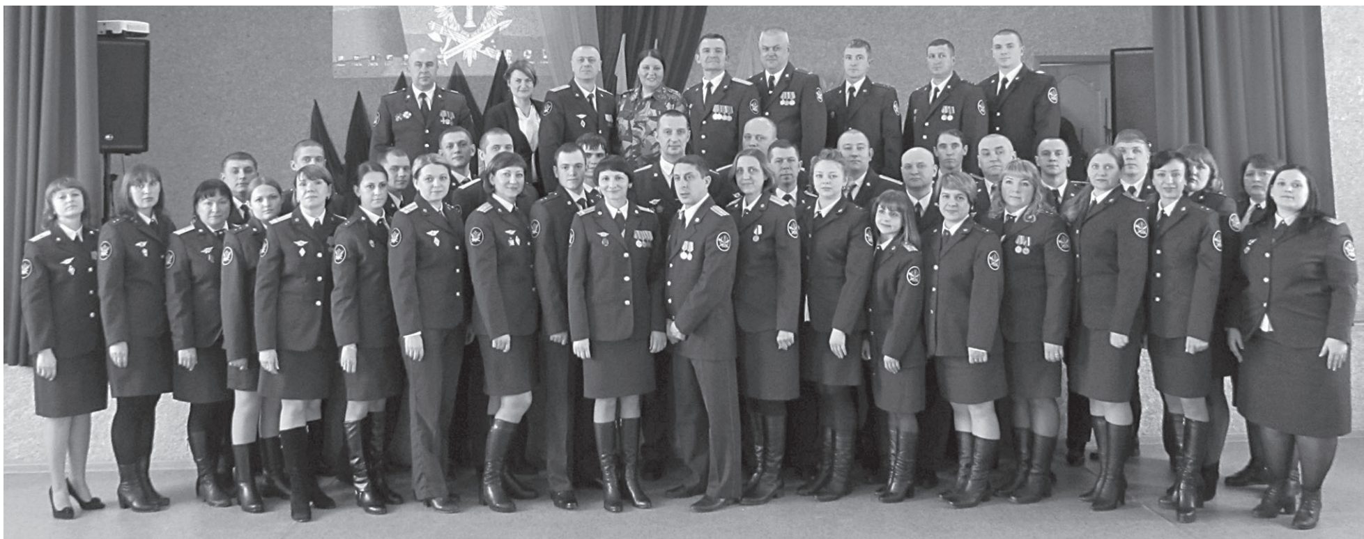
Сотрудники колонии достойно несут свою службу