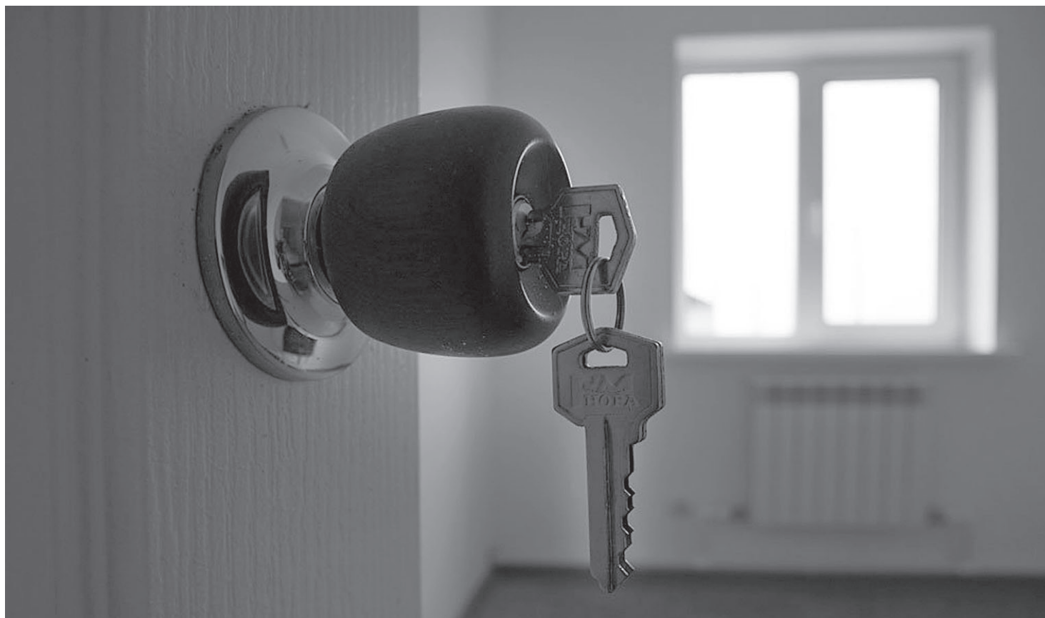
Однокомнатные квартиры популярны среди инвесторов и небогатых покупателей.

В десяти регионах – Якутия, Приморье, Крым, Омск, Санкт-Петербург, Ленинградская и Кемеровская области, Кубань, Бурятия, Адыгея – доля «однушек» в новостройках превышает 60%. И только в восьми регионах, среди которых Карелия, Дагестан, Сахалинская область, Пермский край и другие, таких квартир в новых домах менее 40%.